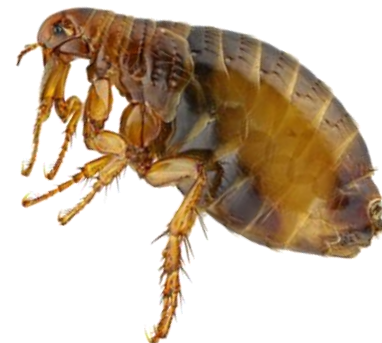
الحشرات الزاحفة Crawling insects