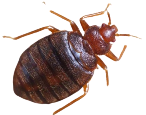
بق الفراش Bed bug

Action: IGR (Contact & Stomach) (بالملامسة والمعدة) منظم نمو للحشرات